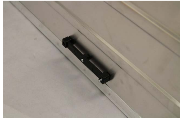
Unteren Halter mit Pfeilrichtung nach oben montieren