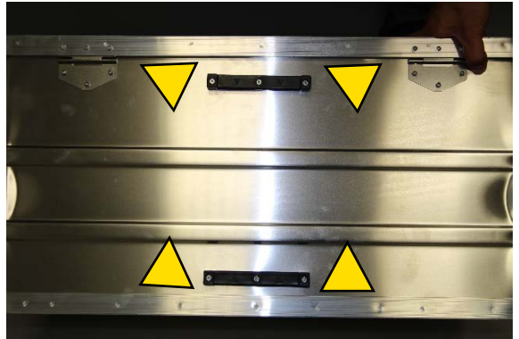
Oberen Halter mit Pfeilrichtung nach unten montieren