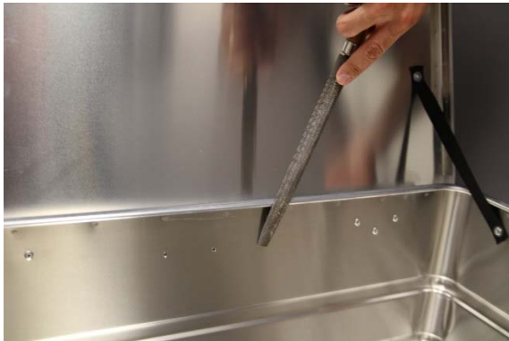
Mit Feile Bohrlöcher entgraten