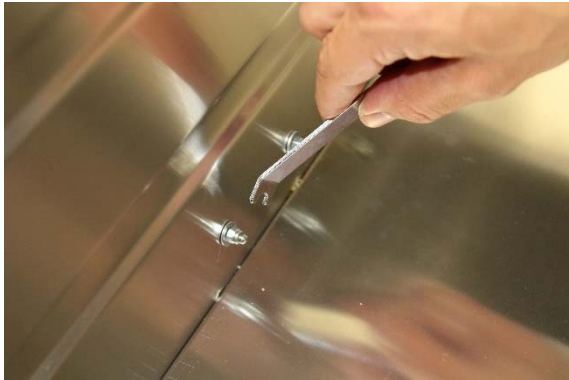
Schrauben mit Muttern und Unterlegscheiben sichern