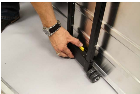
Trolley am unteren Halter einklicken, dabei gelbe Taste betätigen